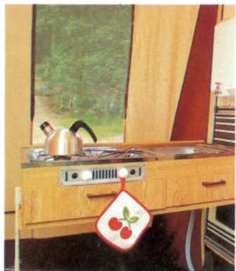
De verplaatsbare keuken voor méér ruimte binnen.