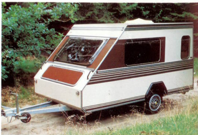
Op de weg: een lage, lichte, zuinige "aanhanger".