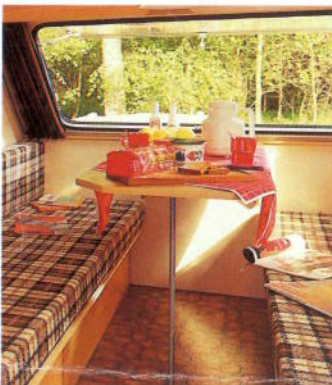
Overdag een complete gezinset- hoek, 's nachts een comfortabel en royaal 2-persoonsbed.