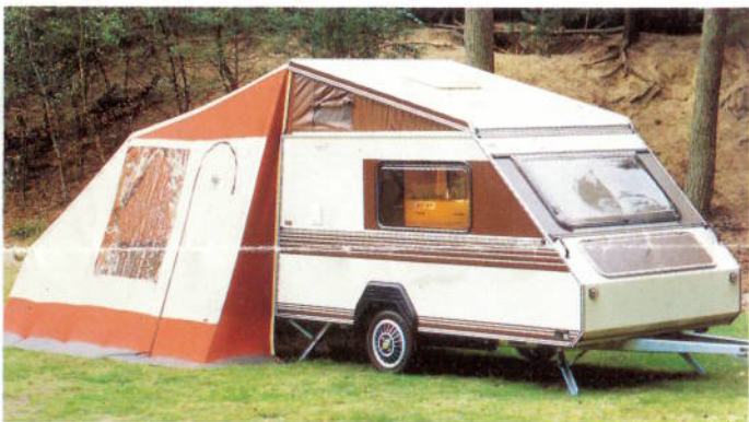
Op de camping: snel omgetoverd tot een riant buitenverblijf.